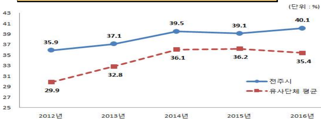
유사 지방자치단체와 사회복지비 비율 비교

☞ 세출분야 중 사회복지비가 40.4%로 차지하는 비중이 높은 것으로 나타났으며, 보육료, 기초연금, 기초생활수급자 지원 등 사회복지 정책 확대에 따라 사회복지비 비중은 지속적으로 증가할 것으로 전망됩니다.